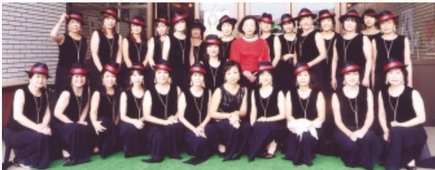
コーロラ・ビスタ(宝塚)