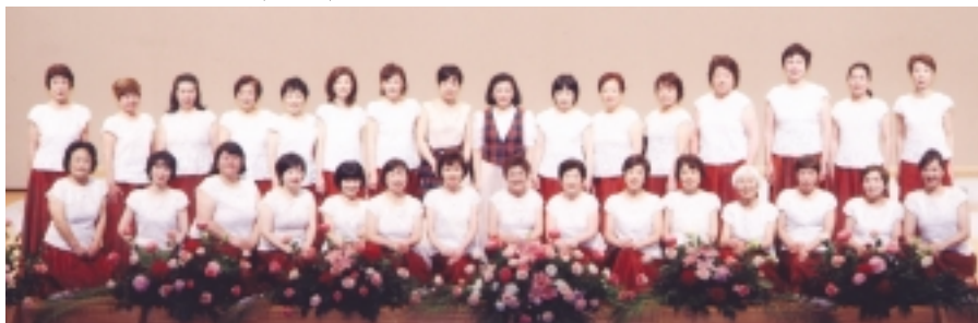
女声コーラス Mion (大阪)